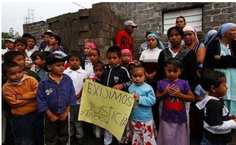
مکزیک: بیش از 650 هزار کودک کار

کار کودک: علل و عواقب تداوم فقر بخش یازدهم برنامه بین المللی برای محو کار کودک ژان مائینات