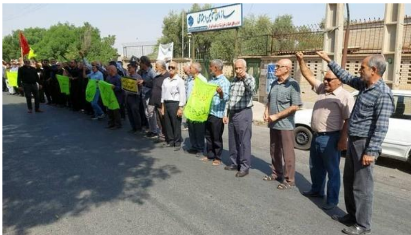
ادامه اعتراضات هفتگی بازنشستگان در شهرهای مختلف