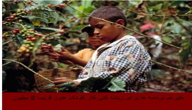
عمر غم برنامه ها برای ریشه کنی کار کودک هنوز قریب 6 میلیون

کار کودک: علل و عواقب تداوم فقر بخش چهاردهم برنامه بین المللی برای محو کار کودک ژان مانیات