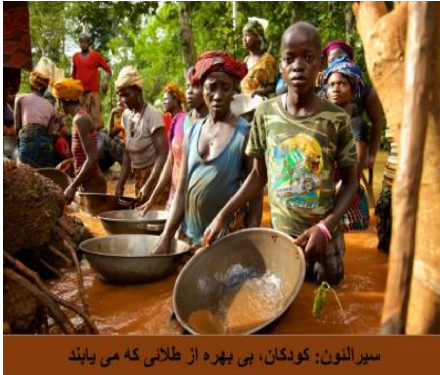
سیرالئون: کودکان، بی بهره از طلائی که می یابند

نقش حمایت اجتماعی در امحای کار کودک گزارش مشترک سازمان بین المللی کار و سازمان یونیسف بخش هیجدهم