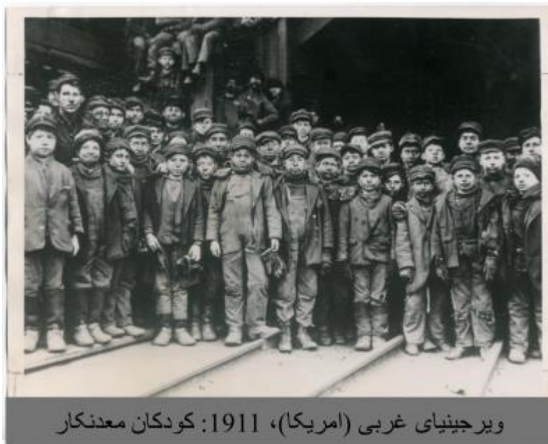
ویرجینیای غربی (امریکا)، 1911: کودکان معدنکار

نویسندگان: جی پائوبی، میما پریسیک، نادین پراولت، جورج لارنا-آجی، نورین خان یونسکو، قسمت سیاستگذاری و برنامه