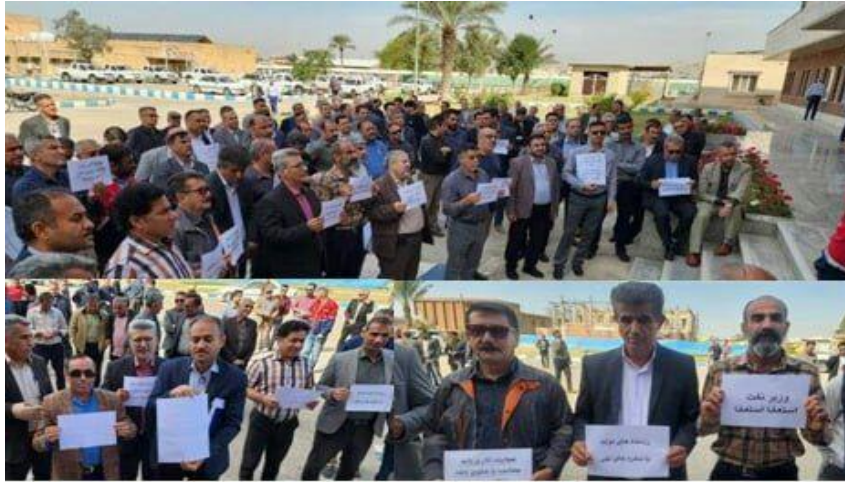
بیستم اسفند: تجمع کارگران رسمی شرکت بهره برداری نفت و گاز آغاچاری