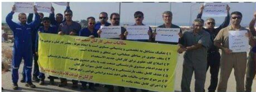
هجدهم اسفند تجمع کارگران رسمی شرکت فلات قاره در لاوان