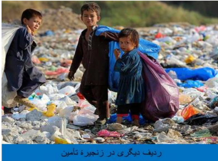
ردیف دیگری در زنجیره تأمین