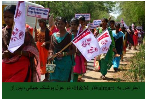
اعتراض به Walmart و H&M، دو غول پوشاک جهانی، پس از